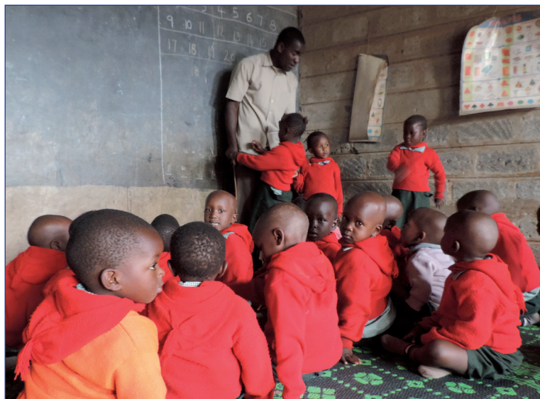
Ein Stipendiat während seiner Sozialarbeit in einem Kindergarten für HIV-infizierte Kinder.

Umstände die Primarschule absolvieren und aufgrund ihrer guten Ergebnisse einen Platz in der St. Aloisius Secondary School der Jesuiten bekommen. Nach ihrem sehr guten Schulabschluss und einem sechsmonatigen Sozialpraktikum hat sie inzwischen mit einem Bachelor-Studium für "Public Health" begonnen.